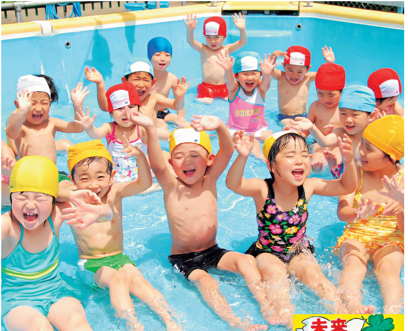
内山保育園プール開き