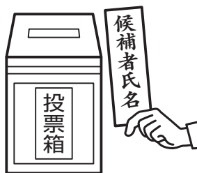
候補者氏名を書いて投票します