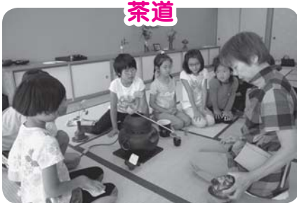
ちょっと苦いけどおいしいな

6月30日に田口小学校3年生46名があいとぴあ白田で体験学習を行いました。茶道・三味線・編み物・パソコン・陶芸の5つのグループに分かれ、学び合いました。学習グループの皆さんの優しい教えにだんだん慣れ、楽しく学習しました。