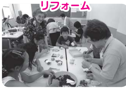
たくさんお手玉作ったよ