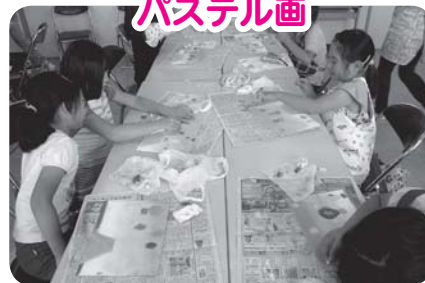
初めてだけど上手に描けたよ