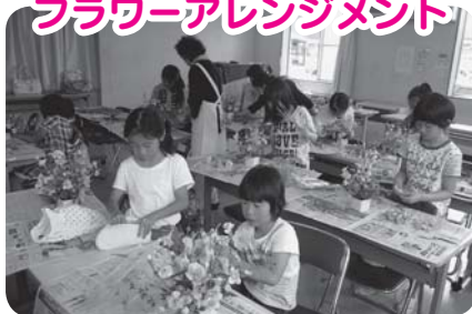
綺麗なお花、みんなに見せたいな