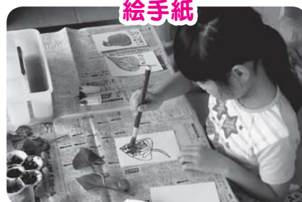
葉っぱってどんな色をしているかな