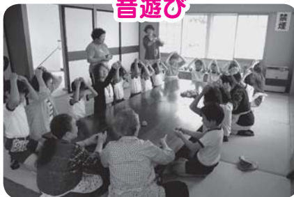
昔の遊びって楽しいな