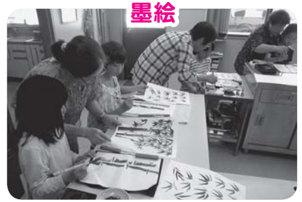
墨で濃淡をきれいにさせたよ