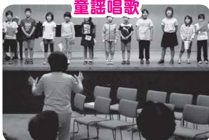
練習の成果を発表します