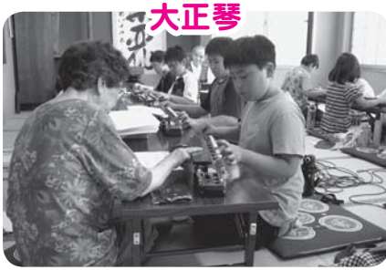
両手で弾くのは難しいな

東小学校4年生54名が5グループに分かれ体験学習を行いました。〈大正琴〉では爪の使い方や弦の弾き方を学び、「かえるの合唱」等を演奏し、〈リフォーム〉では使わなくなった布にあずきを入れ、お手玉を作って遊びました。その他に、墨絵・囲碁・フラダンスを体験し、最後に全員合唱をしました。楽しい2時間でした。