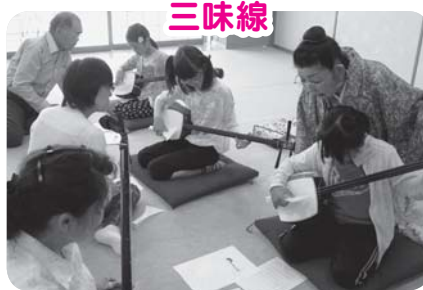
はじめて三味線にさわったよ!