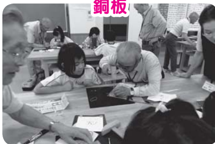
かなづちと釘で真剣勝負