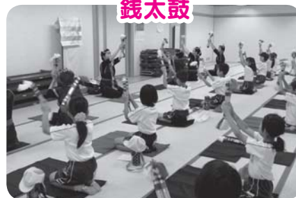
リズムに合わせてテンボ良く