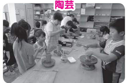
世界に一つだけの作品ができたよ