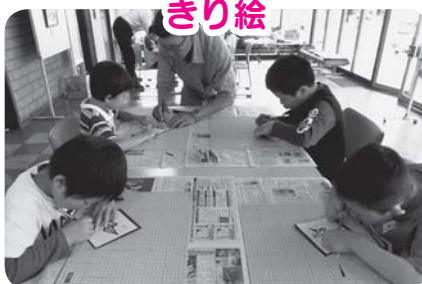
まっすぐ切るって難しいね