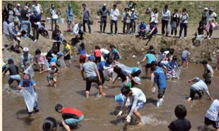
佐久鯉のつかみ取りに挑戦