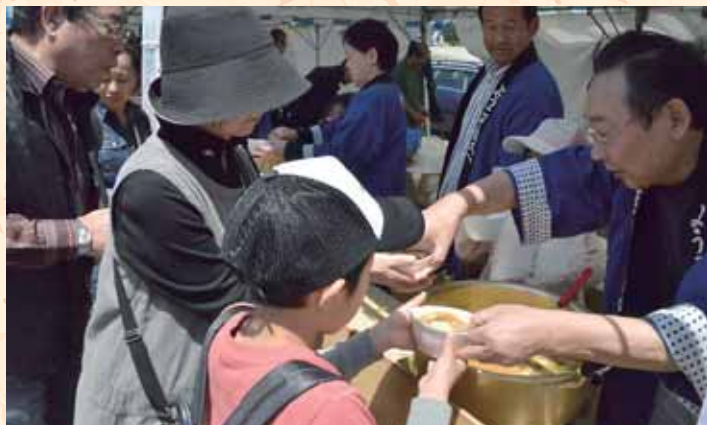
鯉こく無料サービス