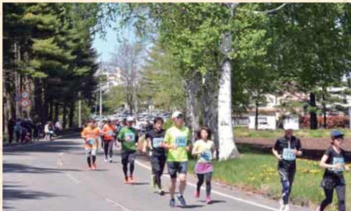
佐久鯉マラソン 爽快に走るランナーの皆さん