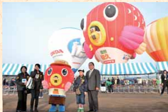
モンゴル大使に来場いただきました