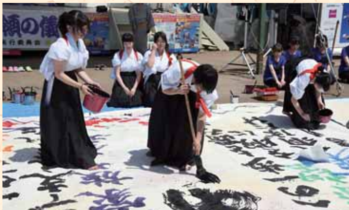
野沢南高校書道部 書道パフォーマンス