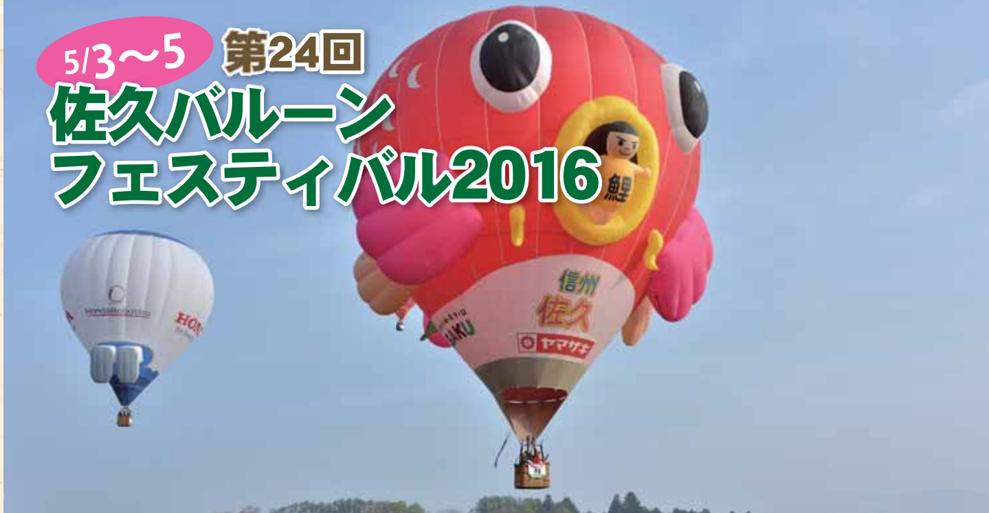
オフィシャルバルーン「佐久の鯉太郎」