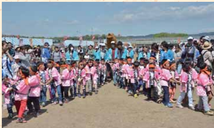
毎年恒例、鯉車巡行