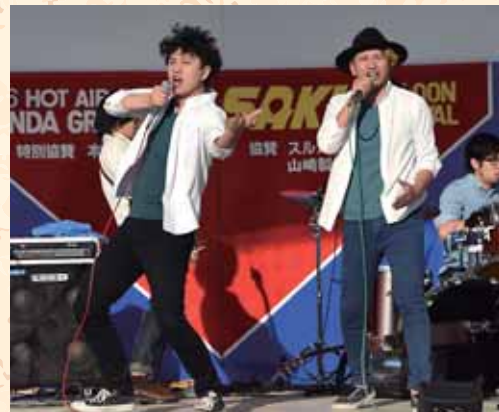
佐久市出身「アランヒルズ」のライブ