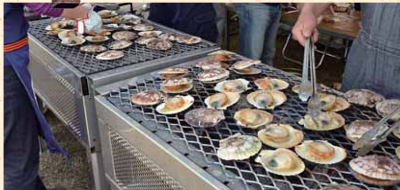
復興支援として開催した「大船渡市」のホタテ販売