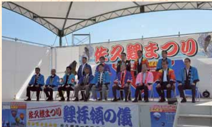
友好都市の皆さんにお越しいただきました