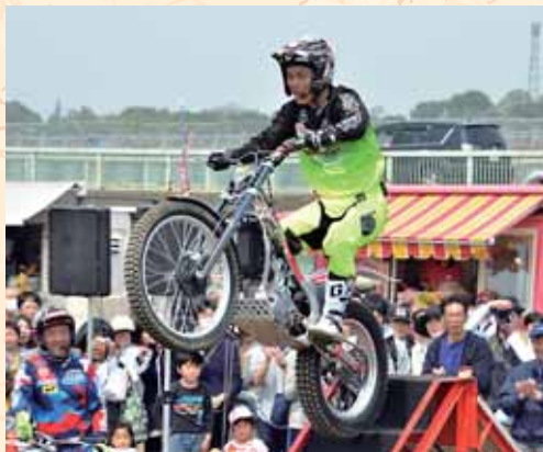
ホンダバイクトライアルショー