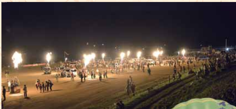
目の前でバーナーオン！！