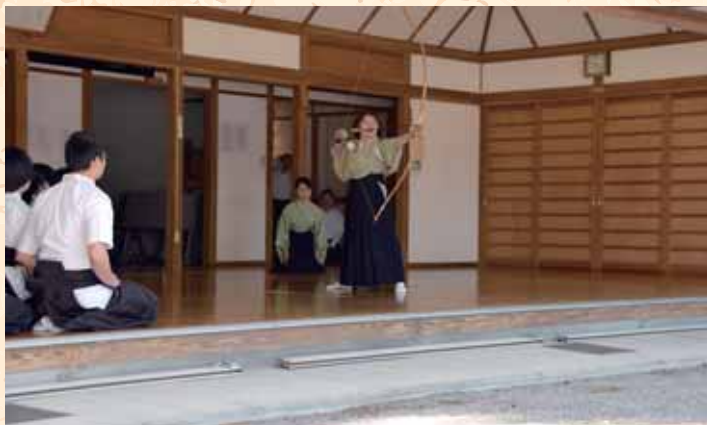
各所でスポーツ大会も開催されました