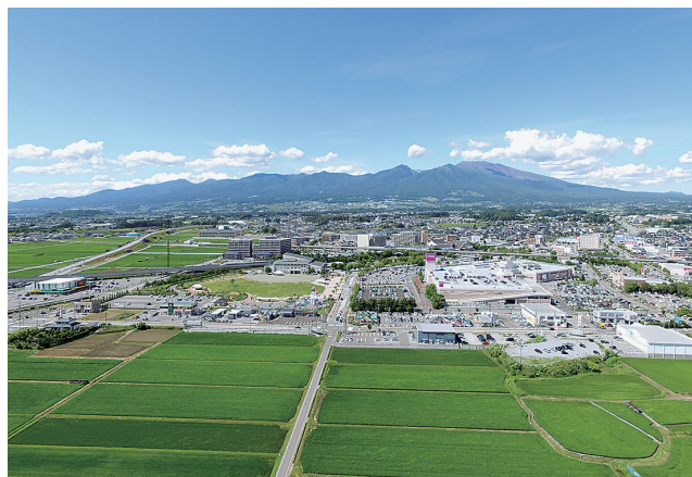
佐久平駅南土地地区画整理