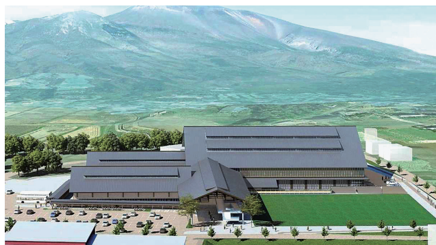
武道館完成イメージ図