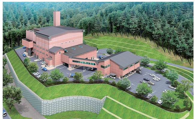
新クリーンセンター完成予想図