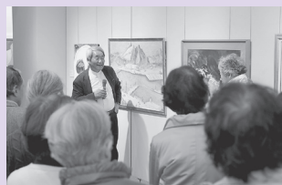
作品鑑賞会の様子