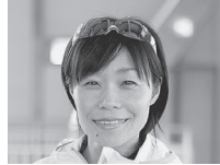
2007年世界陸上女子マラソン第6位 嶋原 清子 氏