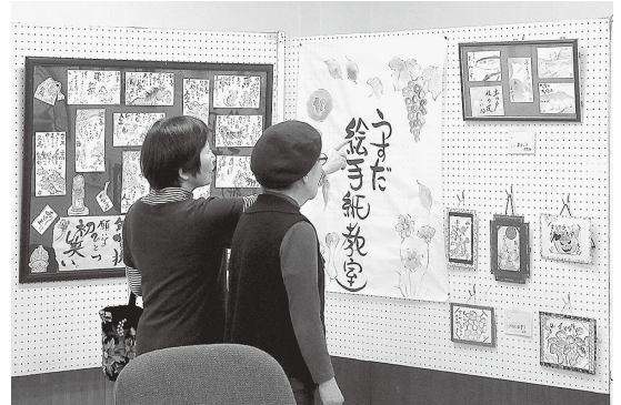
第14回市民総合文化祭より