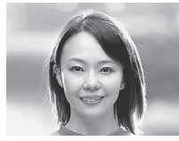
2003年世界陸上女子マラソン銅メダル 千葉 真子 氏