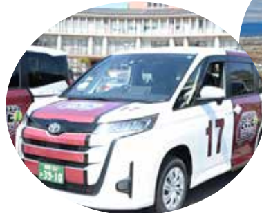
デマンドワゴンさくっと