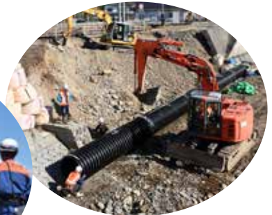
令和元年東日本台風災害復旧工事