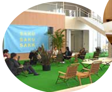
ワークテラス佐久