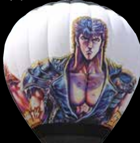
北斗の拳バルーン