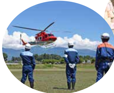
佐久市総合防災訓練