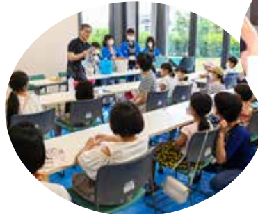
佐久市子どもまつり