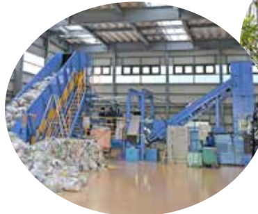
容器包装プラスチックの 中間処理施設(委託業者)