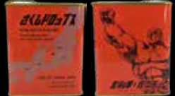
さくしドロップス 北斗の拳 ver