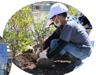
小学校の緑化活動