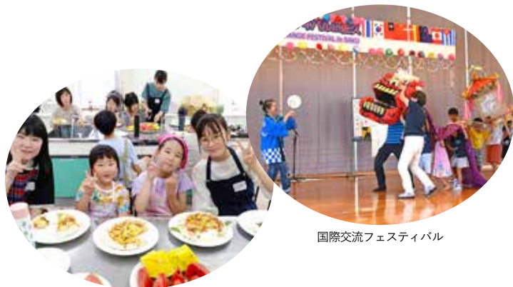
まるごとキャンパス企画 ミノリキッチン