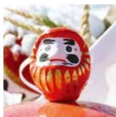
奉焼祭で勢いよくだるまが燃え上がる様子は圧巻