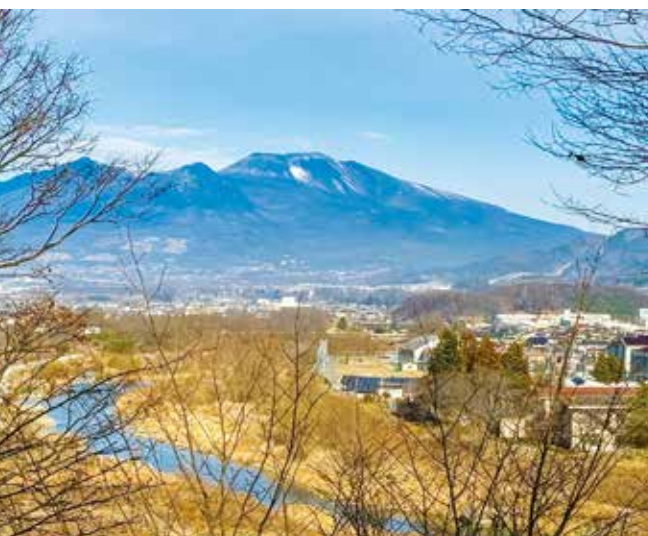
神楽殿からは、眼下の千曲川とその先にそびえる浅間山の絶景が楽しめます。

残念ながら、いつの時代に建てられたものかは分かっていないそうです。毎年行われる小満祭では、この神楽殿で神楽が奉納されます。