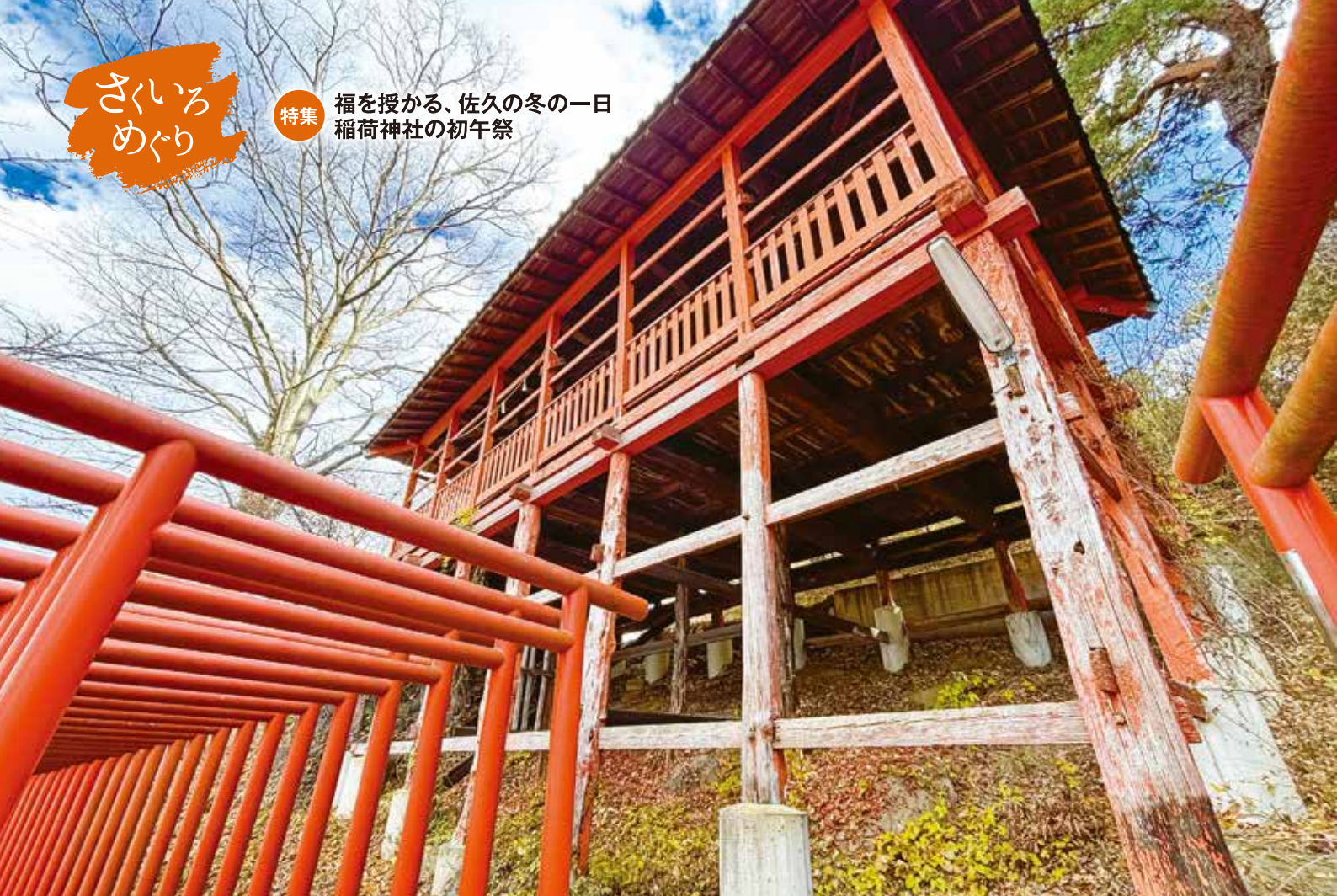
懸崖造りの神楽殿と連なる鳥居がつくり出す丹色の景色