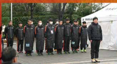
競技終了後の報告会

次々と前の走者を追い上げる最後まで諦めない走りは、多くの市民に感動を与えてくれました。