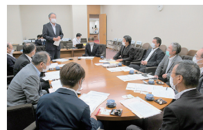
大分市議会議長より子ども条例制定までの取組等について説明を受けました。

当委員会で取組んできた「佐久市こどもの権利条例」制定に向けて、調査研究の一環として、議員提案により子ども条例を制定した大分市議会を視察。関係団体との意見交換や子どもアンケートの実施など条例制定までの取組や広報パンフレットの作成など制定後の活動について説明を受け、議会としての役割について理解を深めることができました。