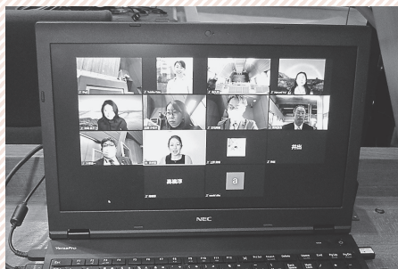
オンライン会議 (Zoom) の様子