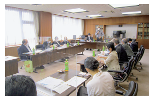
合志市議会での行政視察の様子