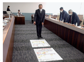
意見交換会の手法説明の様子

市民の皆さんにより議会へ興味を持って頂ける様、より一層の議会の見える化に向け、SNSの利活用や、見やすい広報紙作りに関して学んだ。議会と市民との意見交換会への参加者増員にむけての工夫や、SNS利用に関して規約や運用方法等について参考にできる点が沢山あった。