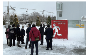
防災について学ぶことができる防災学習交流センター「そなえる」

滝川市では連携先の利益増、利用者の満足度、図書館の情報発信の充実による地域の活性化。札幌市では学校統合による地域の活性化に向けた民間活力の導入手法。IT活用により人口減少社会において、真に市民生活の向上につながる市民目線によるデジタル改革。千歳市では「学ぶ、体験する、備える」を、疑似体験し防災に関する知識を習得。