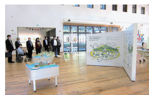
市民が環境について学ぶことができる「かごしま環境未来館」

日置市では生ごみを常設のごみ捨て用容器にいつでも出すことができ、出された量に応じて奨励金を自治会に還元する取組により、生ごみリサイクルと可燃ごみ量を減少したことについて視察。