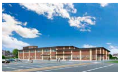
生涯学習センター南側駐車場完成イメージ