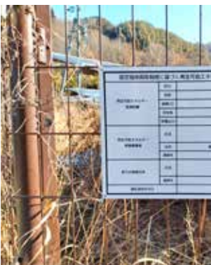
保守点検責任者が倒産し、除草されない野立てソーラー