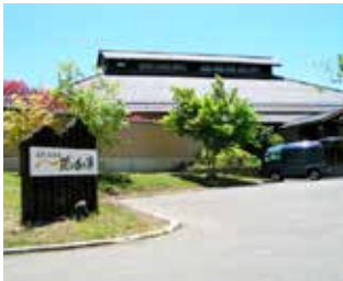
個別施設計画対象施設 穂の香乃湯