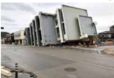
能登半島地震の被災地