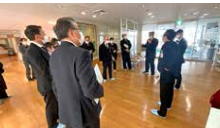
社会委員会現地調査（シルバーランドみつい）

の基準を下回ることを確認。委員からは、介護給付費の削減のため介護・認知の予防に努めることを要望。入院時のテレビ・冷蔵庫の使用は、日額定額制に移行し、患者さんの負担が減ることを確認。