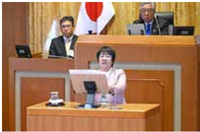
予算決算委員会での審査内容を本会議において報告