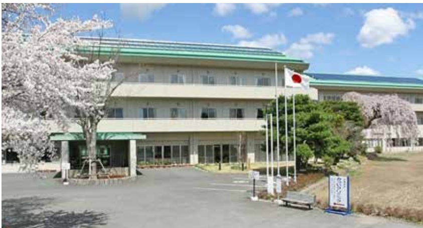
シルバーランドみつui

A 令和4年度に施設園芸等に使用する燃料費補助を実施した。今後の施設園芸等に限らず農業者が農作業に要する燃料費補助については、生活用の燃料費との区分を考慮しつつ、ほかの自治体での支援事例があれば聞きながら、検討していく。