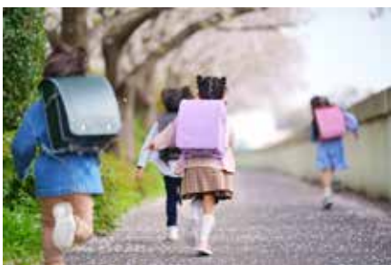
子どもが気軽に立ち寄れる場所が必要

A ドローンでの農薬散布、自動トラクター、ハウスの温度管理システムがある。市の取組では、水田フナの酸素供給の機器を佐久平総合技術高校に開発いただき、機械購入に係る経費の補助を令和6年度に予定。その他県等によるドローン操作体験会には大勢の参加があった。