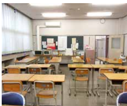
令和7年度の移転に向け現在使われているチャレンジ教室

A 「みんなで未来のチャレンジ教室」として通室している児童生徒でワークショップを実施した。移転により通室困難者も考えられるので、増室も含めた検討をする。