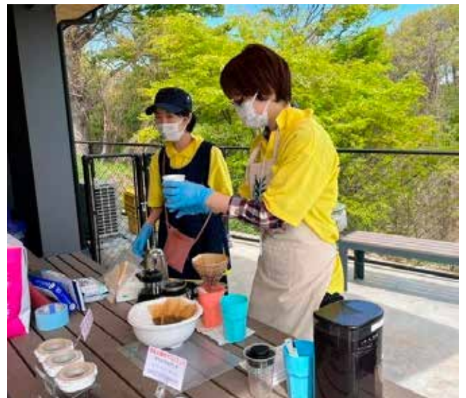
小諸市動物園でイベントを開催。ソーラークッカーで沸かしたお湯で、早速コーヒーを入れるところ。