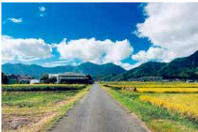
中山間地を魅力ある地域にすることが重要

住民の皆様と連携し、豊かな自然や歴史、文化、風土等の地域の特徴を維持し、一層育むことにより、中山間地域の魅力の向上に努めていく。