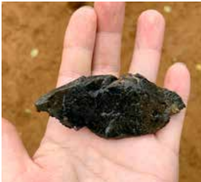
香坂山遺跡から出土された石器

A 令和7年2月の申請を目指す。課題は地権者の同意と膨大な総括報告書の作成。市民の機運醸成も必要。