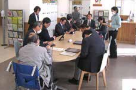
市民活動サポートセンターを現地調査

に経済的な交流なども視野に、両市の発展に寄与できるような交流を進めてもらいたいとの要望が出されました。新規陳情2件については、全会一致により不採択と決しました。