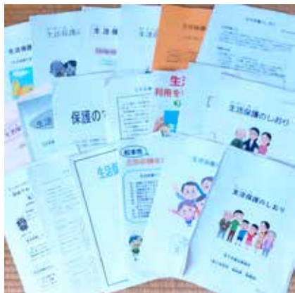
県内19市の『生活保護のしおり』

A 子どもたちが部活動に求める視点や中学校部活動の状況を鑑みながら検討していく。今後、中学生徒と市教委の直接対話の機会も持ちたい。