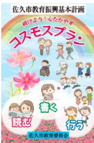
佐久市教育振興基本計画

域を除く、浅科地区全域、佐久、白田、望月地区の山林を除く283・48km 2 (82・03%)が終了。調査未了の3地区は、現況山林のため県下初となる航測法による地籍調査を開始した。なお、航測法は、測量機器を載せた飛行機からレーザーや空中写真を活用した測量手法で、これにより、地上法における現地立合いが不要となる先進的な調査方法である。