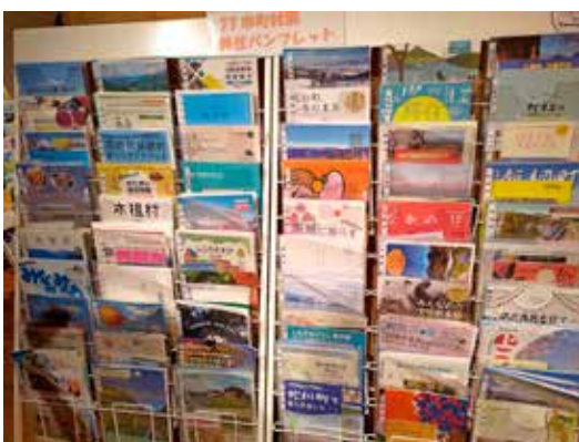
銀座NAGANO 店舗内に設置してある長野県 77 市町村別移住パンフレット

か、移住促進のための活用や就職相談窓口も開設してきた。新型コロナウイルス感染症の影響により活動の自粛を余儀なくされた時期もあるが、個別移住相談会を3か月に1回程度、開催している。いずれにしても、銀座という立地を生かした、観光や物産の振興、移住施策の推進などの信州首都圏総合活動拠点として、今後も「銀座NAGANO」を有効に活用していく。