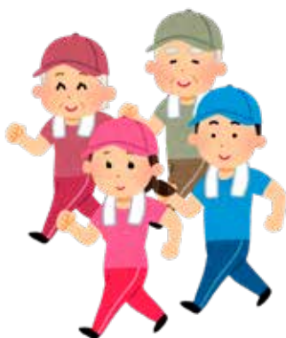
適切な運動習慣を